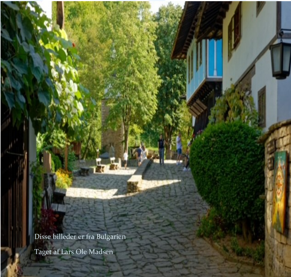
Disse billeder er fra Bulgarien